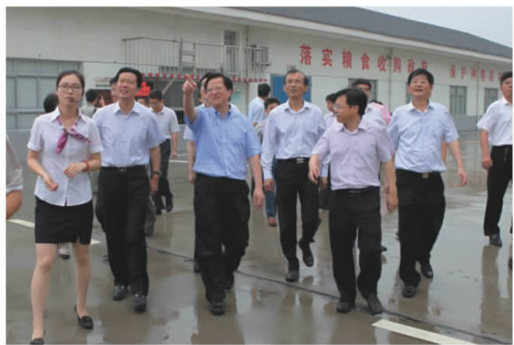
国家粮食局局长任正晓视察公司