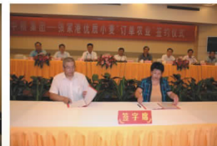
公司与中粮集团签订订单农业合同